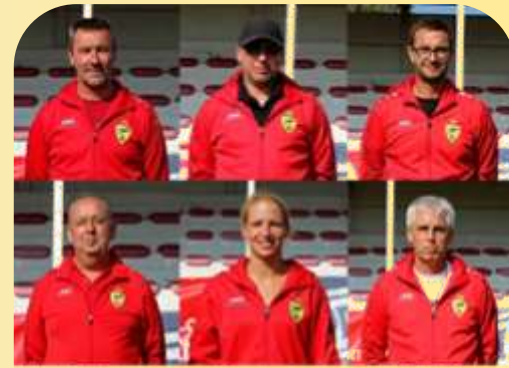
WUSV WK 2018 - Randers / Denmark